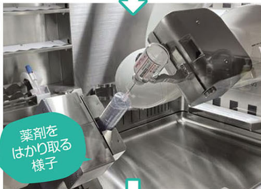
薬剤を はかり取る 様子