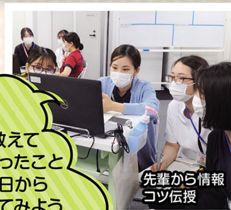
先輩から情報 コツ伝授