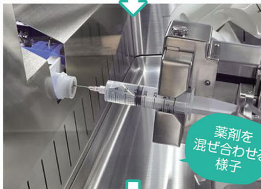
薬剤を 混ぜ合わせる 様子