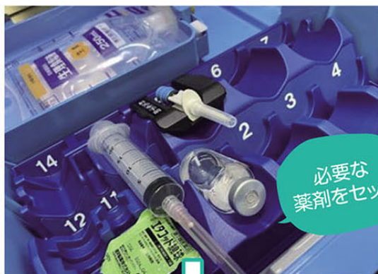
必要な 薬剤をセット