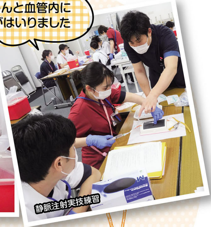
静脈注射実技練習