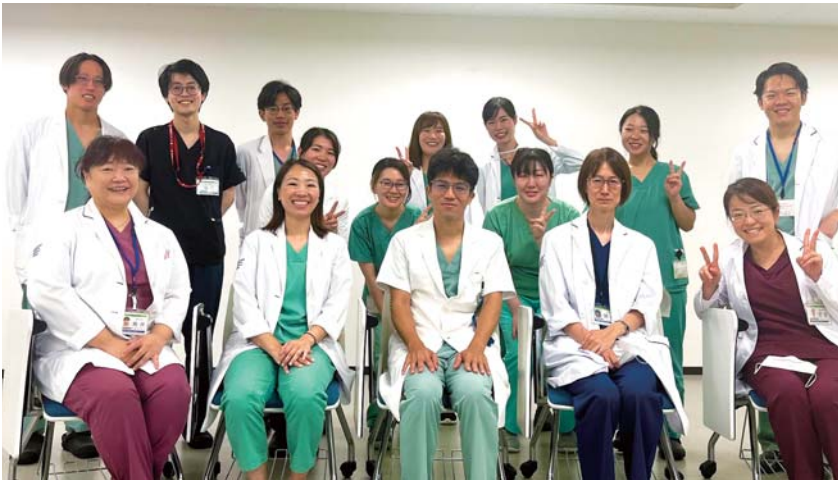
産婦人科医師 産科病棟助産師・看護師