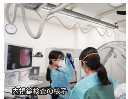
内視鏡検査の様子