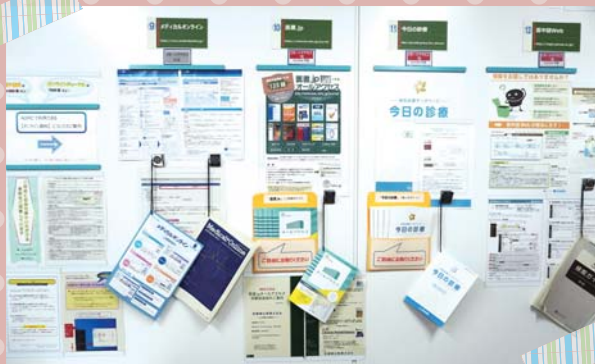
契約中のデータベースが一目でわかるようポスターを掲示