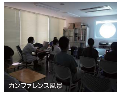
カンファレンス風景

重症肺炎に対しては集中治療部と連携し入院加療を行います。 近年増加傾向にある非結核性抗酸菌症等に対し、適切な治療を提供いたします。