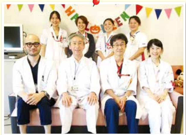
認知症疾患医療センター メンバー