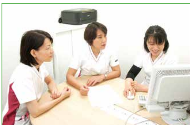
カンファレンス風景