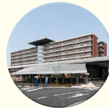
淡路医療センター