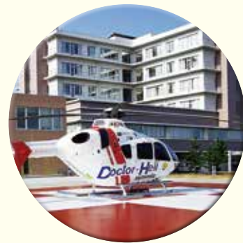
加古川医療センター

平成27年7月より尼崎病院は塚口病院と統合し、 尼崎総合医療センター （730床）になります。 〒660-0892 尼崎市東難波町2丁目17番77号 TEL (06) 6480-7000 FAX (06) 6480-7001