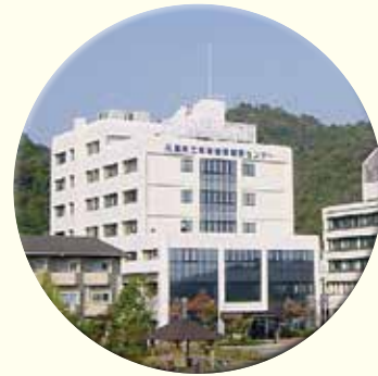
姫路循環器病センター

こども病院 (290床) 〒654-0081 神戸市須磨区高倉台1-1-1 TEL (078) 732-6961 FAX (078) 735-0910