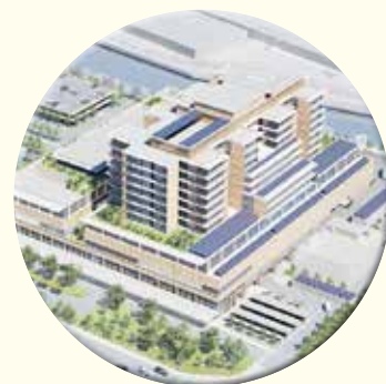
尼崎総合医療センター

尼崎病院 (500床) 〒660-0828 尼崎市東大物町1-1-1 TEL (06) 6482-1521 FAX (06) 6482-7430