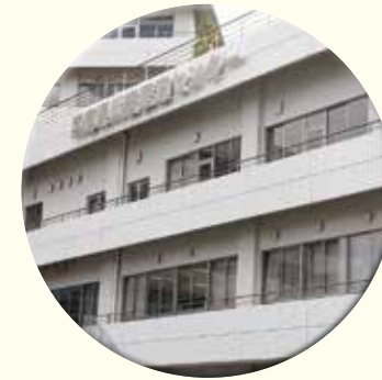
災害医療センター