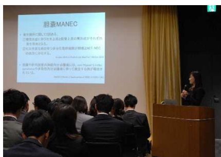
♪2017年度生 研修医発表会♪