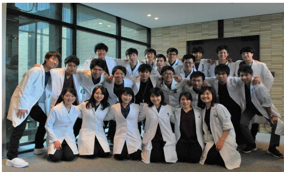
♪2020年度採用 初期研修医♪