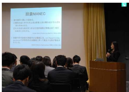
♪ 2017年度生 研修医発表会 ♪