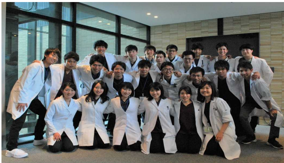
♪2020年度採用 初期研修医♪

選択研修は当院ではもちろんのこと県立病院群形成による総合型病院（西宮、淡路、加古川、丹波）および専門型病院（こども病院、がんセンター、姫路循環器病センター、ひょうごこころの医療センター、粒子線医療センター、災害医療センター、リハビリテーション中央・西播磨病院など）、さらに平成29年度からは製鉄記念広畑病院でも研修が可能となり、バラエティ豊かに選択できます。