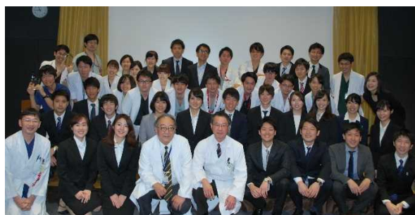
＃2018年度junior resident of the year表彰式＃