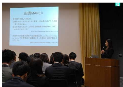
♪2017年度生 研修医発表会♪