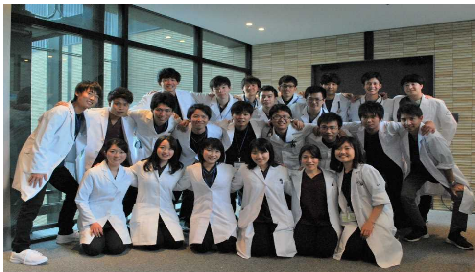
♪ 2020年度採用 初期研修医 ♪

選択研修は当院ではもちろんのこと県立病院群形成による総合型病院（西宮、淡路、加古川、丹波、はりま姫路）および専門型病院（こども病院、がんセンター、ひょうごこころの医療センター、粒子線医療センター、災害医療センター、リハビリテーション中央・西播磨病院など）でも研修が可能で、多彩な選択が可能です。