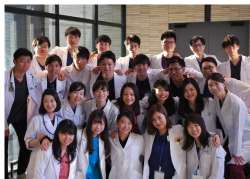
♪2019年度採用 初期研修医♪