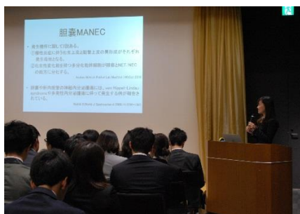
♪ 2017年度生 研修医発表会 ♪