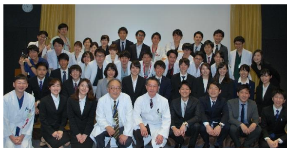
# 2018年度 junior resident of the year 表彰式 #